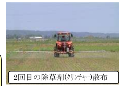
2回目の除草剤(クリンチャー)散布